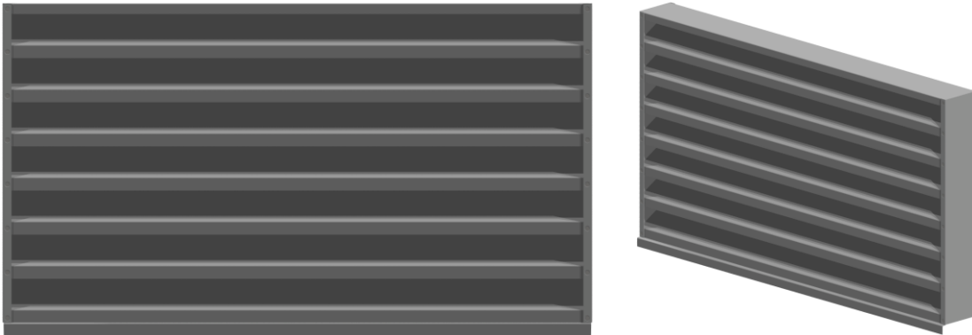
Abbildung 1 – Aluminiumlüftung Typ: LLE

Mit einem Betonbau-Lüftungselement aus Aluminium haben Sie sich für eine sichere Lösung entschieden. Unsere Lüftungssysteme sorgen für einen optimalen Luftaustausch innerhalb Ihres Technikgebäudes. Diese dienen zur Kühlung von Trafo- und Niederspannungsräumen und verhindern, dass Regen und Insekten eindringen. Die einzelnen Elemente können an die baulichen Gegebenheiten flexibel angepasst werden und sind sowohl für den Einbau in Türen als auch in Wände geeignet.